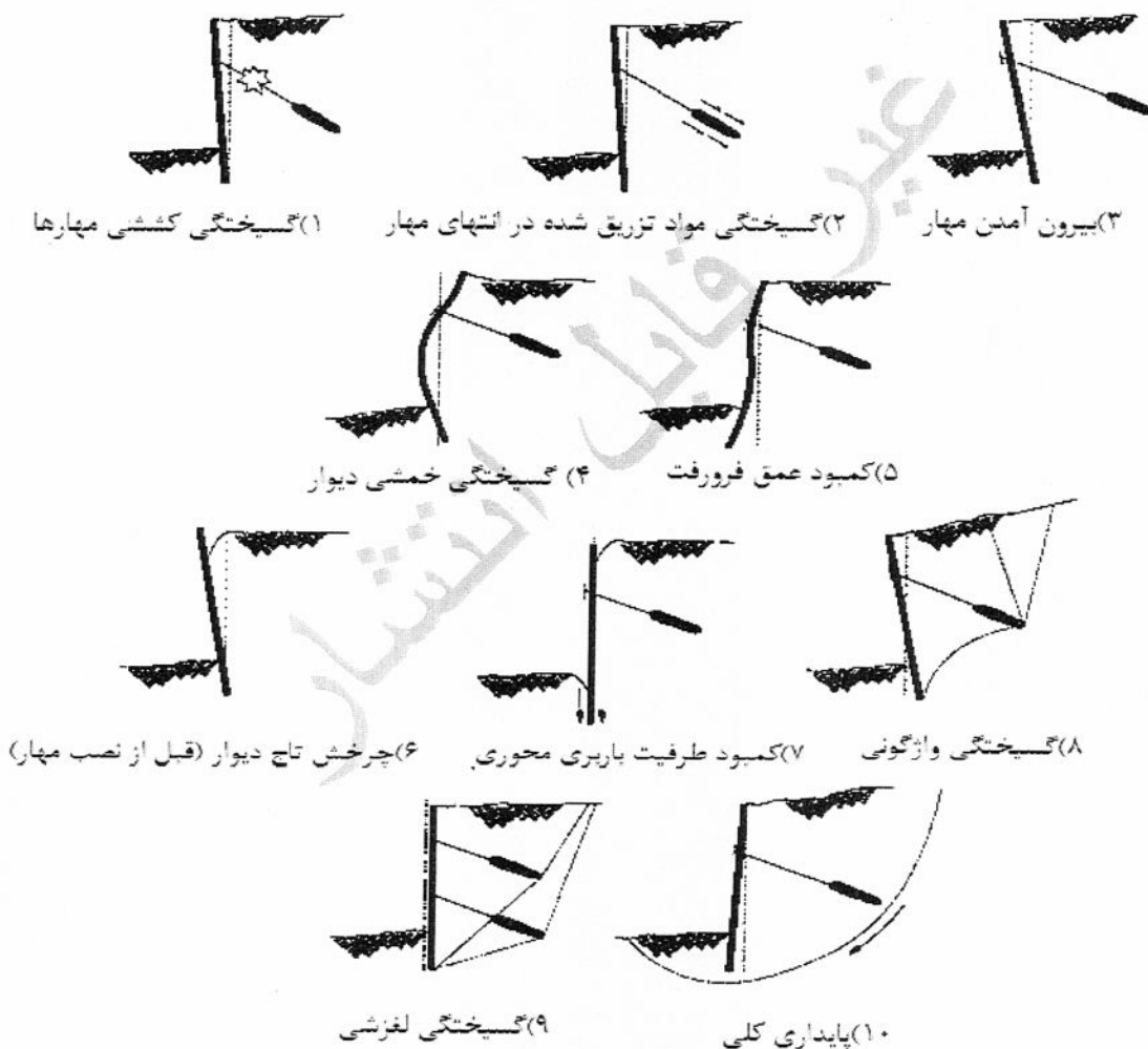
شکل شماره (۷-۵-۱): حالت‌های حدی دیوارهای مهارشده

۷-۵-۳-۲-۱: برای طراحی دیوارهای مهارشده از پشت باید حالت‌های حدی شکل (۱-۵-۷) کنترل شود.